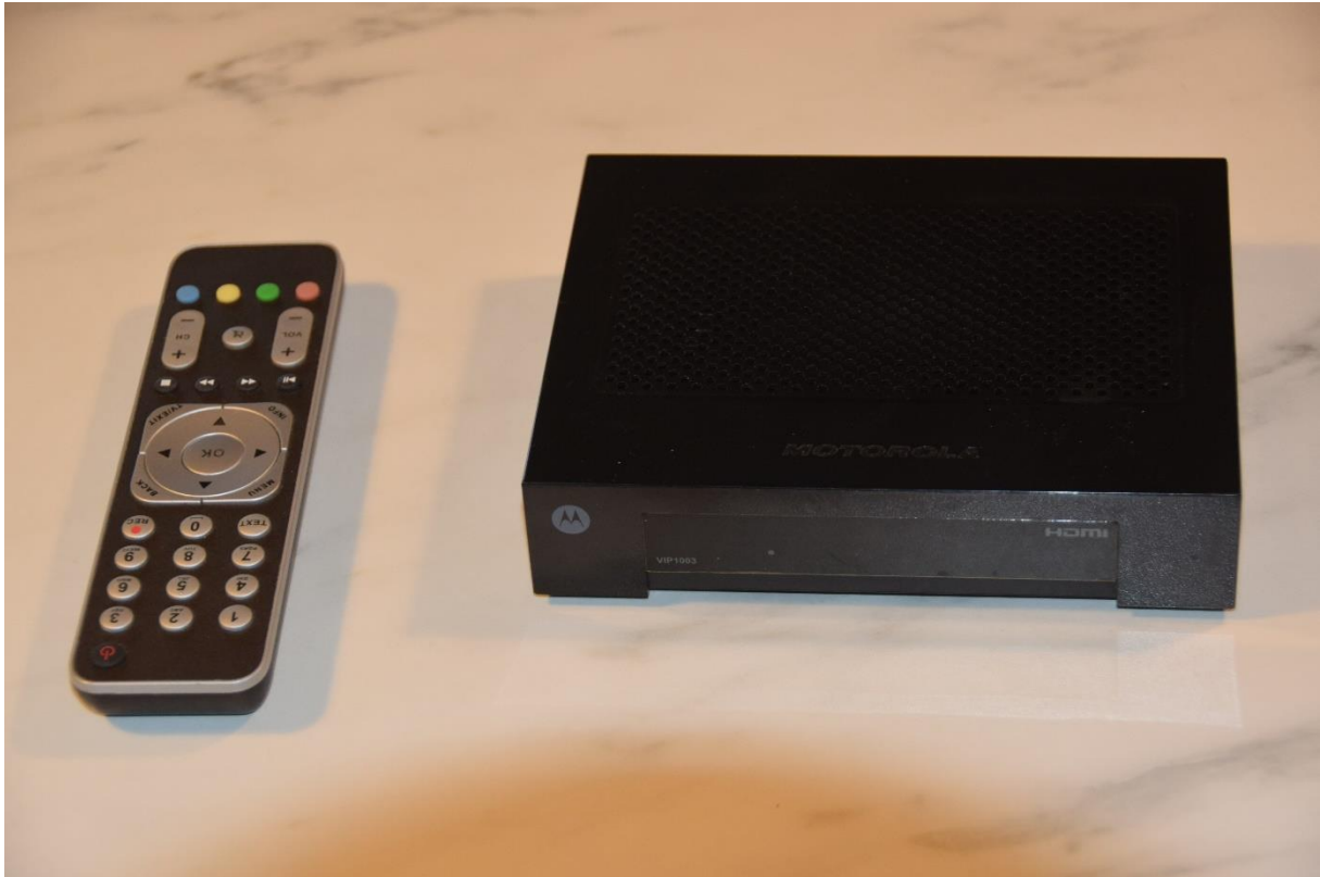
Bild på Motorola äldre TV-box som kommer att sluta fungera. Det finns en inspelningsbar box som är ganska lika Motorolaboxen men den är av annat märker och berörs inte. Fortfarande oklart vad som gäller!

Enligt den info vi har idag så skall det inte vara några konstigheter att byta TV-box till Arris! Vi har installerat 2 st utan problem.